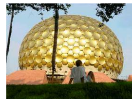
Sri Aurobindo und The Mother

Auch das streng geplante Straßenbild und viele Bauten sind stark französisch geprägt. Dennoch ist es eine typisch indische Stadt mit ihren Autorikschas, Basaren und Hindutempeln. Im Westen bekannt wurde Pondicherry in den vergangenen Jahrzehnten durch den 1926 gegründeten Aurobindo-Ashram und die nahe gelegene Siedlung „ Auroville “ aus den 1960ern, in der Menschen aus aller Welt versuchen, auf ökologischer Basis in einer spirituellen Gemeinschaft friedlich zusammenzuleben. Sie besichtigen hier das weltbekannte Sri Aurobindo Ashram, mit den blumengeschmückten Gräbern des großen indischen Philosophen und Freiheitskämpfers Sri Aurobindo und The Mother , sowie die gotische Sacred Heart Church .