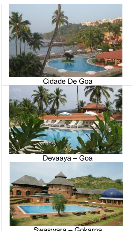
Cidade De Goa