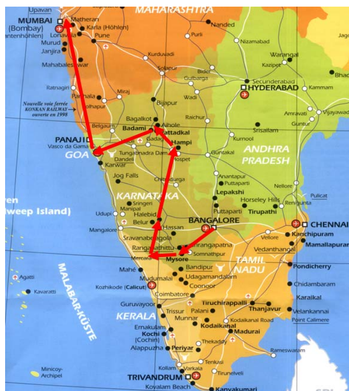
Swaswara – Gokarna