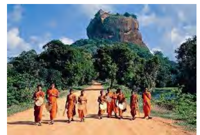
von der eine Wendeltreppe zu den

Anmerkung: Wer Probleme mit der Hitze, den Gelenken oder dem Kreislauf hat, sollte evtl. überlegen, auf den Aufstieg zu verzichten. Stattdessen kann man entweder nur den halben Felsen bis zu den „Wolkenmädchen“ erklimmen , oder sich im neuen Museum und der antiken Gartenanlage am Fuße des Felsens umsehen.